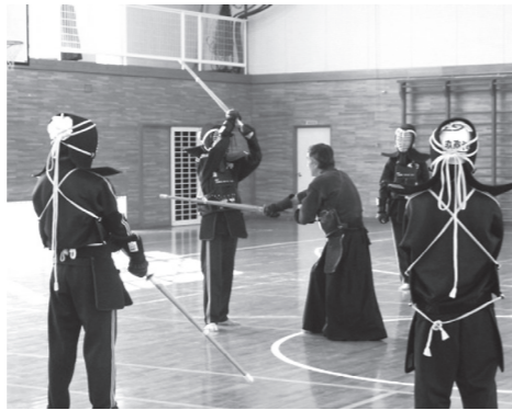
外部指導者派遣事業（剣道）

③外部指導者派遣事業の実施 武道必修化に対して、教員の指導力向上を図るために、県教育委員会が地域の外部指導者を派遣