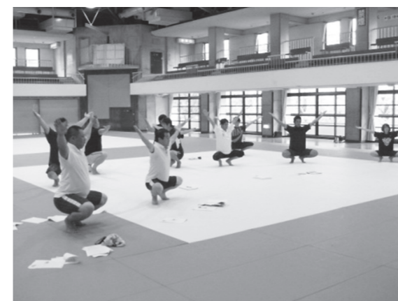
武道指導者講習会（相撲）