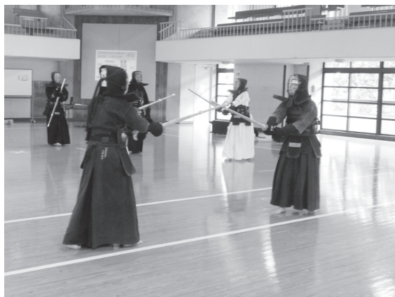
体育実技指導者講習会（剣道）