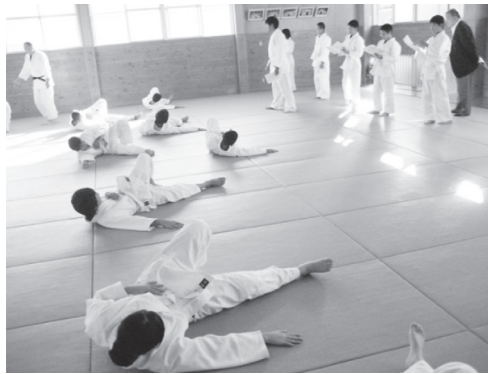
外部指導者派遣事業（柔道）