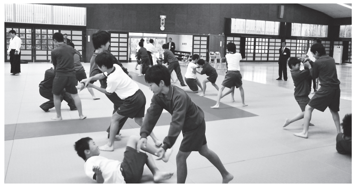
和歌山県田辺市立明洋中学校の授業風景

る。研修会では、『合気道指導の手引』の解説、授業における合気道の指導法の解説と実技指導、保健体育科教員による模擬授業の紹介等を実施している。実際に初めて合気道に触れることで、合気道授業採用の糸口になってくれるものと考えている。また、各都道府県連盟の代表者が集まり、それぞれの中学校武道への取組についても話し合われている。