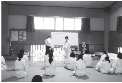
外部指導者とのTT学習(香川県丸亀市立飯山中学校)

現状から考えられる今後の大きな課題として、合気道を指導できる教員の不足が挙げられる。この教員不足を解消する手立ては4つ考えられる。1つは保健体育科教員に講習会などを通じ技術を身に付けてもらうことである。8月に「学校合気道実技指導者講習会」、11月に「全国合気道指導者研修会」を実施しており、全国