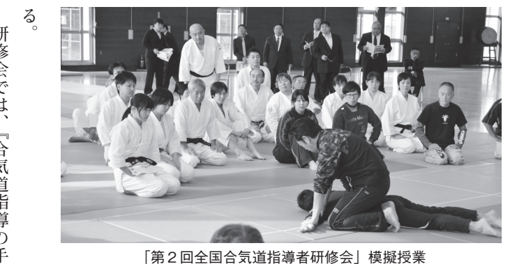
「第2回全国合気道指導者研修会」模擬授業

平成22年からは、日本武道館と共催で「中学校武道授業(合気道)指導法研究事業」が毎年行われ、合気道未経験の中学生に協力いただき、実際に授業を行い、作成された指導案の検証をしている。平成25年から日本武道館と共催で、「全国合気道指導者研修会」を開催し、中学校・高等学校保健体育科教員、将来保健体育科教員になる可能性のある大学生、各都道府県連盟の代表者が参加してい