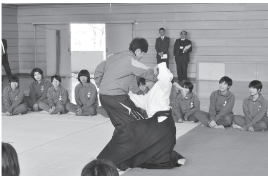
体操マットでの授業（愛知県弥富市立十四山中学校）

合気道の採用校を見ると地域的な特性があり、合気道にゆかりのある地域で合気道の授業が行われ