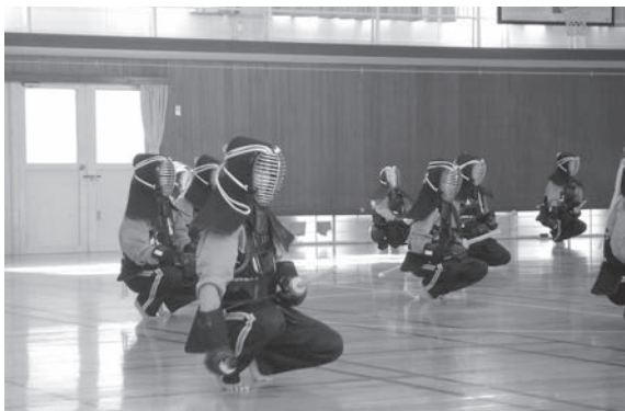
剣道具を装着した授業（蹲踞）

まず、府の事業である「平成22年度中学校武道必修化に向けた地域連携指導実践校事業」を受け、2校が実践校として取り組んだ。続いて、文部科学省の学校体育振興事業である「平成23年度中学校武道必修化に向けた地域連携指導実践校事業」の委託を受け、16校が実践校として取り組んだ。この二つの事業を活用して、市内18校すべての学校が、平成24年度からの武道の必修化に向けて研究し、取組を進めた。 特に、16校が実践校として取り組んだ平成23年度の文科省委託事業では、「新学習指導要領に対応した単元計画の作成と指導のあり方」「地域の指導者と保健体育担当教員の連携のあり方」をテーマに、以下の内容で実施した。 〈趣旨〉 中学校で平成24年度から男女共に必修となった武道を安全かつ円滑に実施できるよう、地域指導者・団体等の協力のもとで教員の