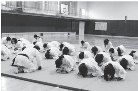
柔道授業では礼法もしっかり学ばせる