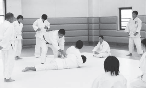
教員研修 (実技講習会)