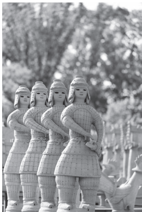
武人埴輪（今城塚古墳）

高槻市は、北には緑豊かな北摂連山、南には水量豊かな淀川が流れており、自然豊かなまちである。また、京都と大阪の間に位置し、古くから都と西国を結ぶ交通の要所となっており、市内には古き良き歴史と文化が残っている。自然豊かな環境や交通の利便性などから、平成15年には人口35万人を超える中核市へと発展した。