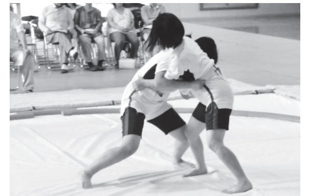
学校行事の校内相撲大会の様子