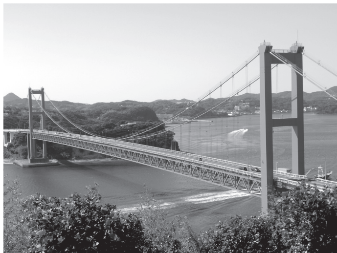
九州本土と平戸市を結ぶ「平戸大橋」

長崎県の北西に位置する平戸市は、人口約3万3千人。離島を除いた日本の陸路の最西端に位置する自然にも恵まれた、歴史とロマンあふれる城下町です。 400年ほど前、日本で最初の西洋貿易港として、イギリスやオランダとの交流が始まりました。 昨年は、地元開催の「がんばらんば国体」で、地元選手の活躍もあって成年相撲2連覇を成し遂げたり、「長崎の教会群とキリスト教関連遺産」を構成資産として、世界遺産登録に向けて念願の国の推薦を受けたり、ふるさと納税額において日本一となったりと、嬉しい出来事がたくさんありました。