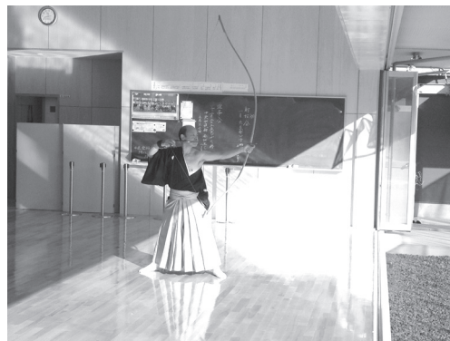
地域指導者の演武を見学（弓道場）