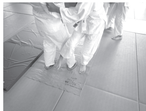
足技シートを利用し、投げる様子