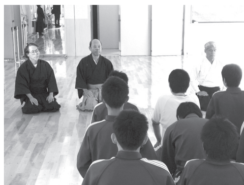
地域指導者からの評価（弓道場）