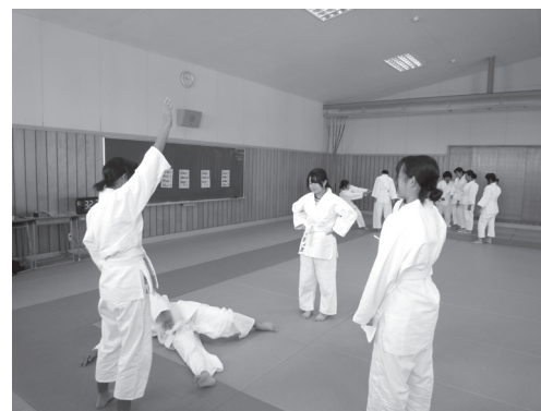
「一本」ミニゲームを競い合う様子