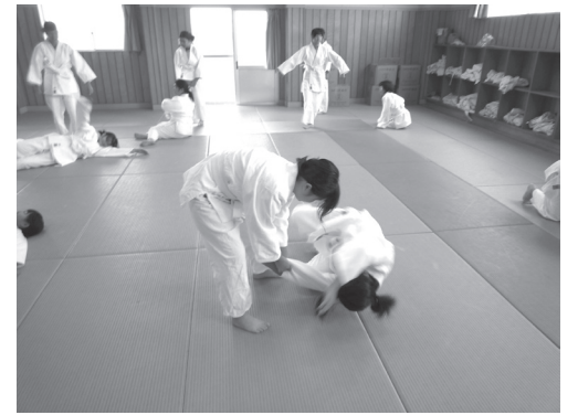
もどき技で稽古する取と受の様子