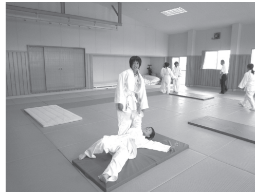
安全マットに投げこむ様子