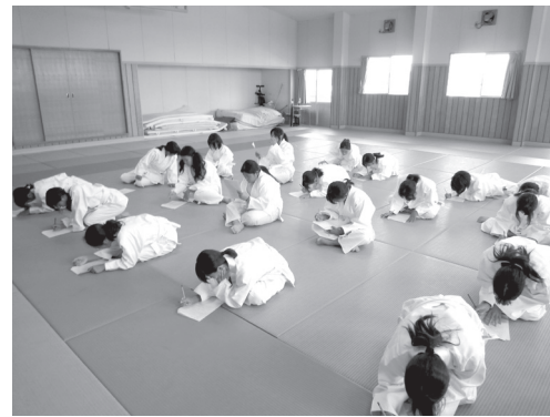
学習ノートに記入する生徒の様子