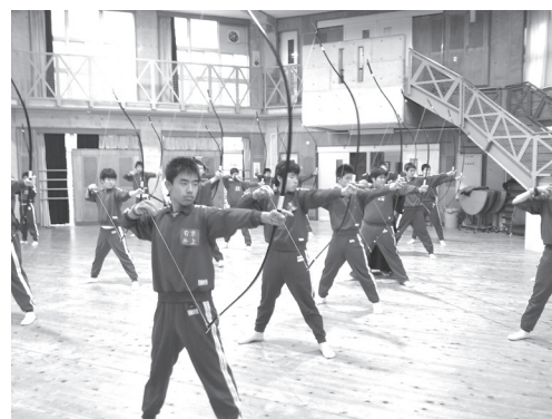
学校の多目的教室での基本習得