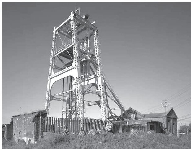
明治日本の産業革命遺産の1つ 三池炭鉱宮原坑跡

また、本市は平成23年度末に市内全小・中・特別支援学校（当時34校）が一斉にユネスコスクールに加盟し、各学校がESD（持続可能な開発のための教育）を推進し、学校の特色を生かした教育活動を展開している。