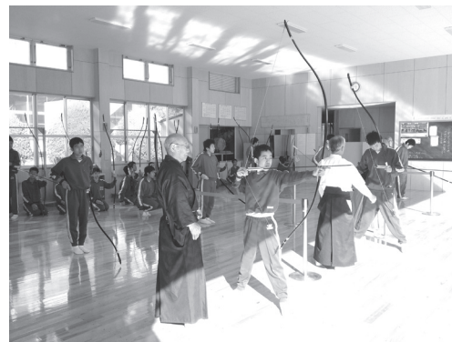
学習のまとめとして、弓道場での納射