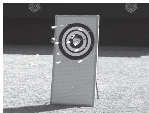
本時もこんなに多くの矢が！（弓道場）