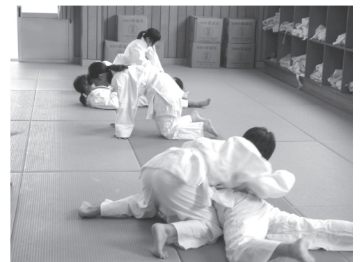
簡易ゲーム「固め技」の様子