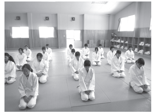
黙想をしている生徒の様子