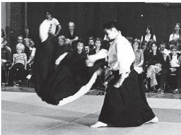
フィンランドで演武する筆者(右)(昭和52年頃)

は、人数も少なく、稽古が終われば、車座になってお茶を飲みました。先輩が買ってきたお菓子を食べながら、武道論や世間話に花を咲かせて意思の疎通や何気ない会話から生じる勇気をもたらっていました。