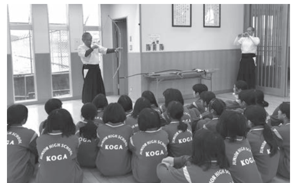
指導者の説明を聴く生徒