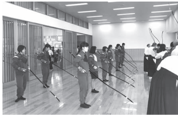
控え・本座にて順番待ちの様子