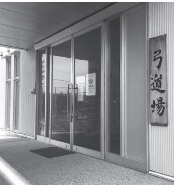
古賀中学校弓道場

はじめに、弓道の歴史や特性について、教室でビデオを視聴した（2年生については、昨年度にビデオ視聴済み）。1年生で弓道の経験がある生徒は皆無で、視聴を通して弓道に対する興味関心を高