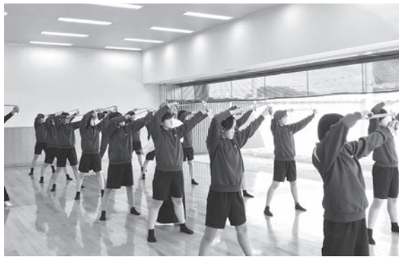
射位にて弓を引る直前の様子