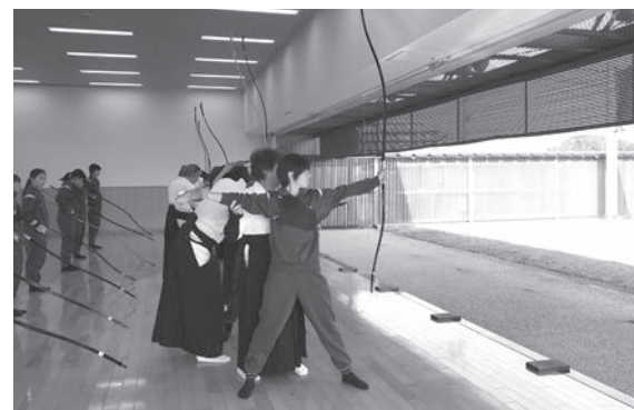
素引きで「射法八節」を練習する