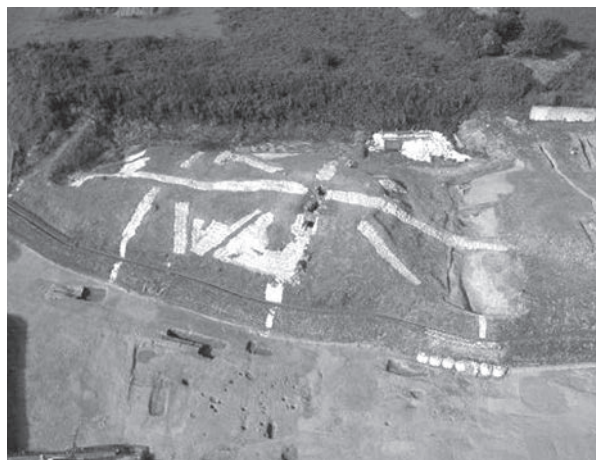
国史跡「船原古墳」の前方後円墳と土坑群

市の「教育立市（りつし）こがく日本一 通いたい通わせたい学校づくり」の基本理念を受け、古賀中学校では「ふるさと古賀を愛し、豊かな心と知性を持ち、自ら生きる力を培うことができる生徒の育成」を掲げている。