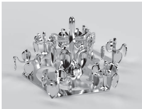
土坑から発見された馬具の一つ「金銅製歩揺付飾金具(雲珠)」