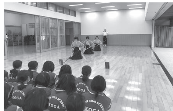
模範演技を見学する