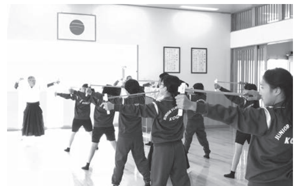
ゴム弓を引く練習