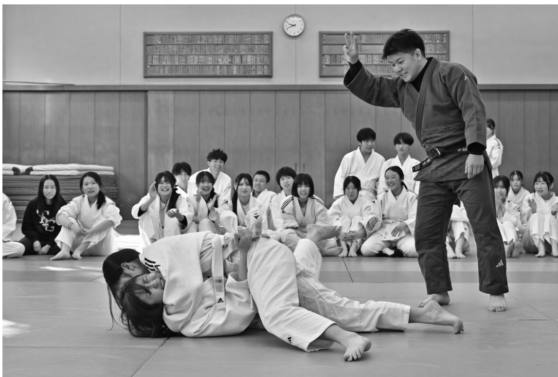
男女ともに参加する寒稽古。最終日には固技の試合を行う。